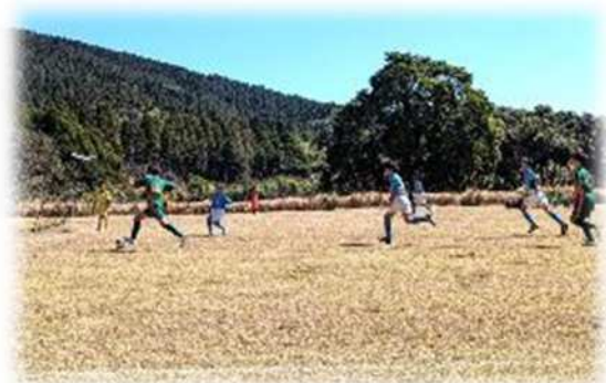
スポーツ研修ゾーンでのサッカー大会