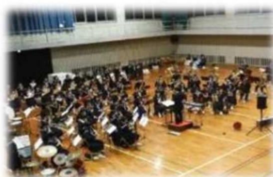
体育館での吹奏楽練習