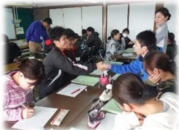
グループワークトレーニング