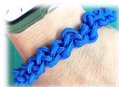
ロープワークブレスレット