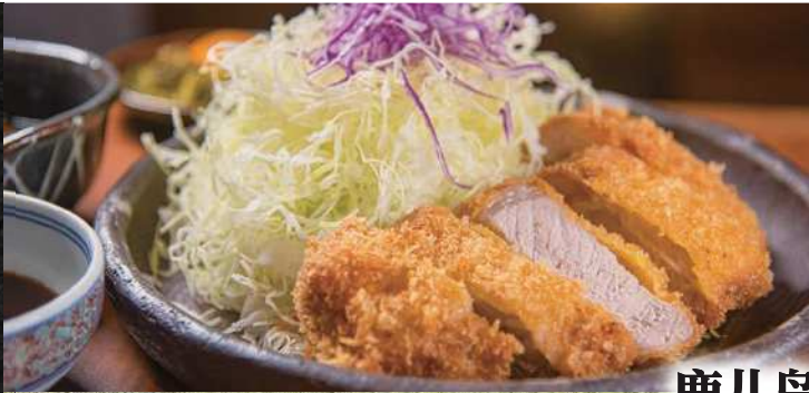
鹿儿岛 黑 猪