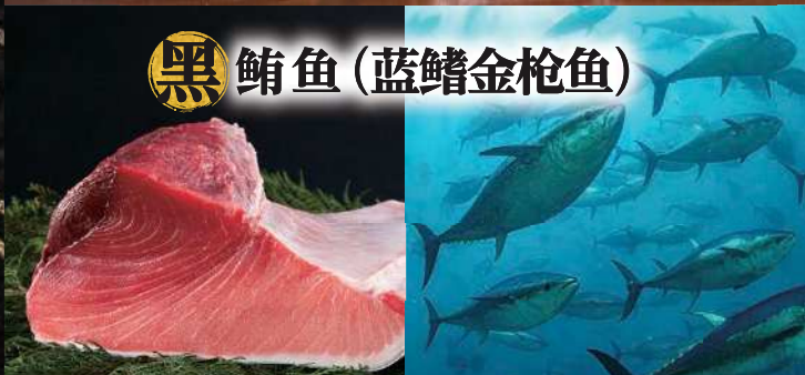
黑 鲔鱼(蓝鳍金枪鱼)