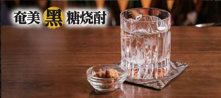
奄美 黑 糖烧酎