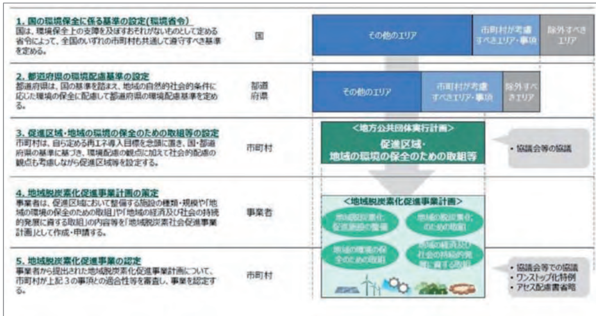
図 6-2 促進区域の設定から地域脱炭素化促進事業計画の認定までの流れ

資料 地方公共団体実行計画（区域施策編）策定・実施マニュアル（地域脱炭素化促進事業編）（環境省）