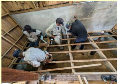
【空き家改修ワークショップ】