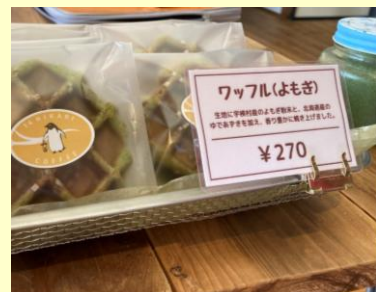
【地元農産物使用の加工品】