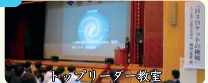
トップリーダー教室

他にも，海外大学企業連携研修など特色ある教育活動を展開し，未来につながる「知・徳・体」を育む全人教育を実践しています。