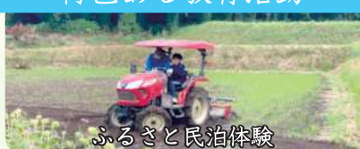
ふるさと民泊体験