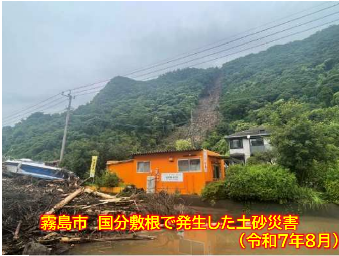
霧島市 国分敷根で発生した土砂災害 (令和7年8月)