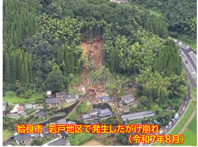
始良市 岩戸地区で発生したがけ崩れ (令和7年8月)